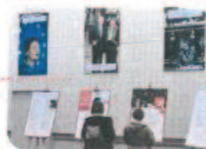
Exposition à l'Assemblée nationale à Paris sur l'égalité des sexes, printemps 2019

L'ONU a proclamé le 8 mars « Journée internationale des femmes », le 25 novembre « Journée internationale pour l'élimination des violences à l'égard des femmes » et le 11 octobre « Journée internationale des filles ».