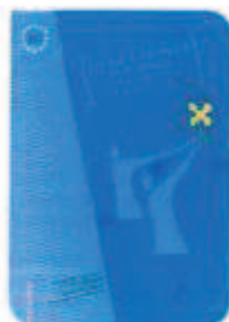
La Charte européenne pour l'égalité des femmes et des hommes dans la vie locale www.egalite-femmes-hommes.gouv.fr

La Charte comporte 30 articles dans tous les domaines d'actions des collectivités territoriales : en tant qu'employeur, donneur d'ordre, prestataire de services... Elle énonce les droits, cadre juridique et politique, et précise les principes et outils nécessaires à sa mise en œuvre concrète et progressive.