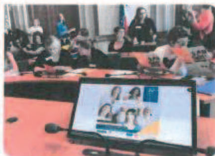
Conférence internationale Professionnel, à l'hôtel de Ville de Paris Le salon dédié aux femmes qui souhaitent entreprendre, retrouver un emploi ou se former

La Charte européenne pour l'égalité des femmes et des hommes dans la vie locale a été réalisée en 2006 dans le cadre d'un projet initié par le Conseil des Communes et Régions d'Europe (CCRE) et ses associations nationales membres. Elle est donc le fruit d'un consensus européen. Son élaboration a été soutenue par la Commission européenne.