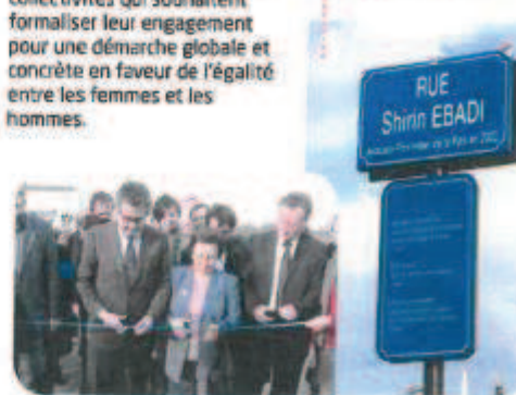
Commune de Saint-Denis (Seine-Saint-Denis) : la rue Shirin Ebadi a été inaugurée, en sa présence, le 14 mars 2013.

La Charte européenne pour l'égalité entre les femmes et les hommes dans la vie locale réalisée en 2006 s'adresse aux collectivités qui souhaitent formaliser leur engagement pour une démarche globale et concrète en faveur de l'égalité entre les femmes et les hommes.